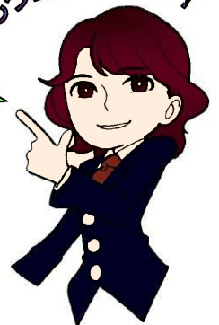
地域ふれあい課 見守りシスターズ W