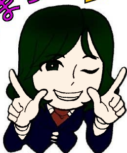
地域ふれあい課 見守りシスターズ I